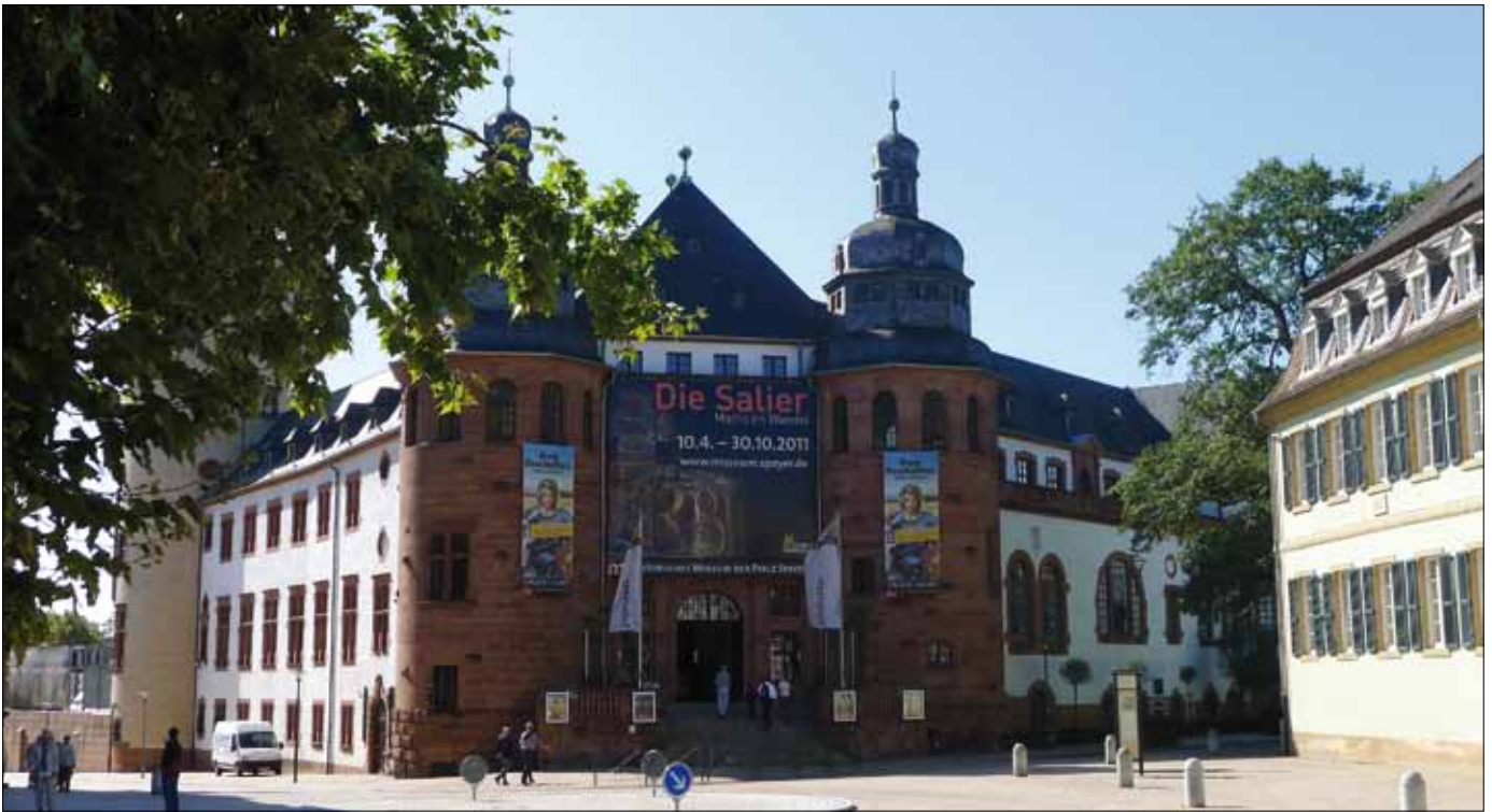
Historisches Museum der Pfalz – mit wechselnden Ausstellungen