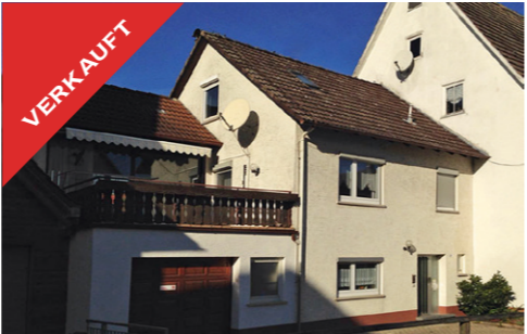
Rottenburg-Baisingen, DHH mit Potential, Mai 2017