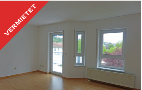
Tübingen, zentrale 2-Zimmer Whg, Mai 2017