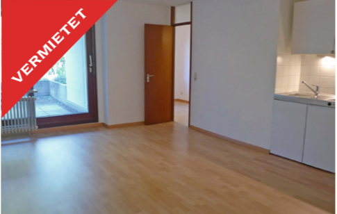
Tübingen, komfortable 2-Zimmer Whg, Mai 2017