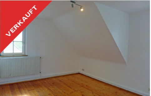
Tübingen, Charmante ETW, Mai 2017