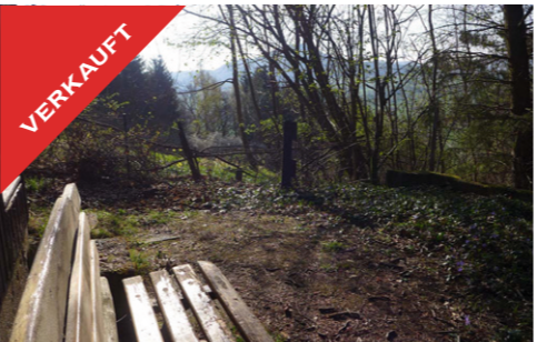
Mössingen, Freizeitgrundstück, Juni 2017