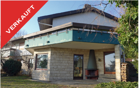
Tübingen, großzügige DHH in Toplage, Mai 2017