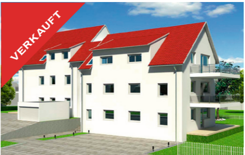
Tübingen, Neubau-Wohnung, April 2017