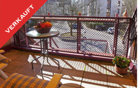
Tübingen, sonnige ETW mit Loggia, Mai 2017