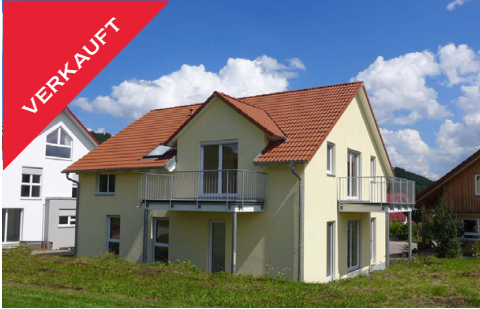
Rottenburg, neues ZFH, Januar 2018