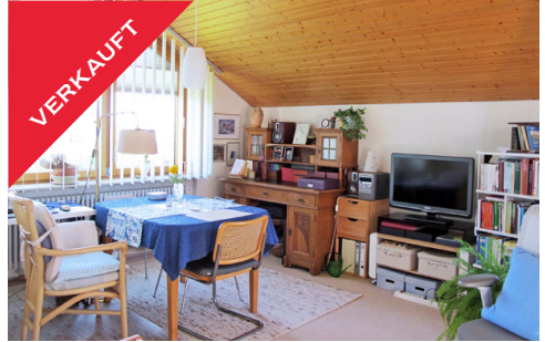
Tübingen, Dachgeschoss-ETW, Januar 2018