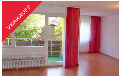
Tübingen, praktische ETW, Dezember 2017