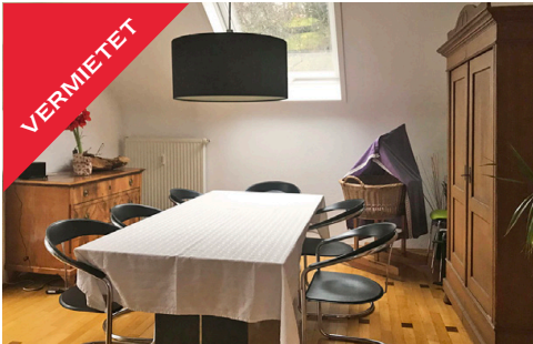
Tübingen, DG-Wohnung, Dezember 2017