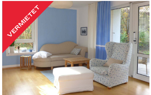
Tübingen, Mietwohnung im EG, Dezember 2017