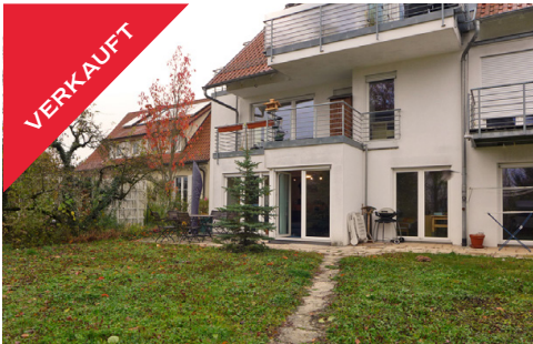
Tübingen, ETW mit Garten, Dezember 2017