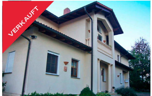
Dettenhausen, EFH mit Gewerbe, Januar 2018