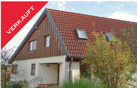
Rottenburg, großes EFH mit ELW, Dezember 2017