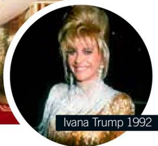
Ivana Trump 1992