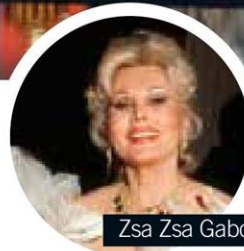
Zsa Zsa Gabor 1981

Zsa Zsa Gabor's einstige Villa in Palm Springs ist um 3,6 Millionen Euro zu haben – inklusive Pool mit traumhaftem Ausblick, zwei Schlaf- und Badezimmern, einem Ankleide-, Schminke- und großen Wohnzimmer.